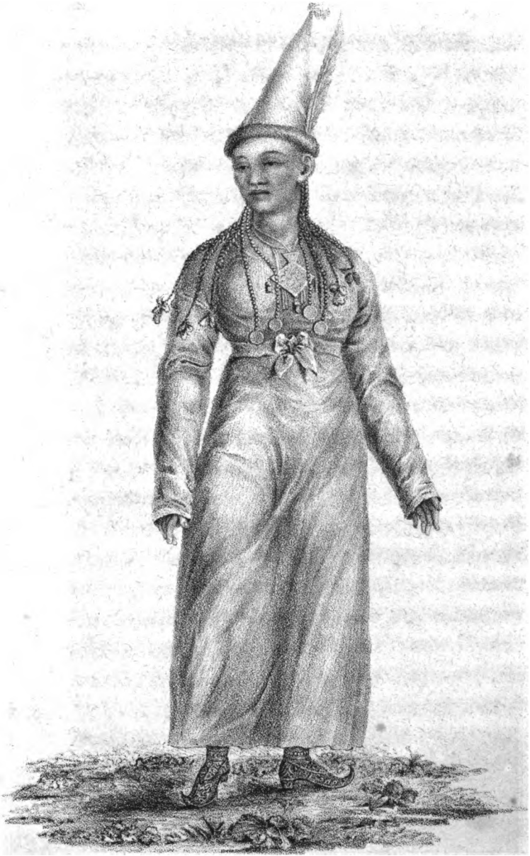
Kupruso Kasarka gourya.