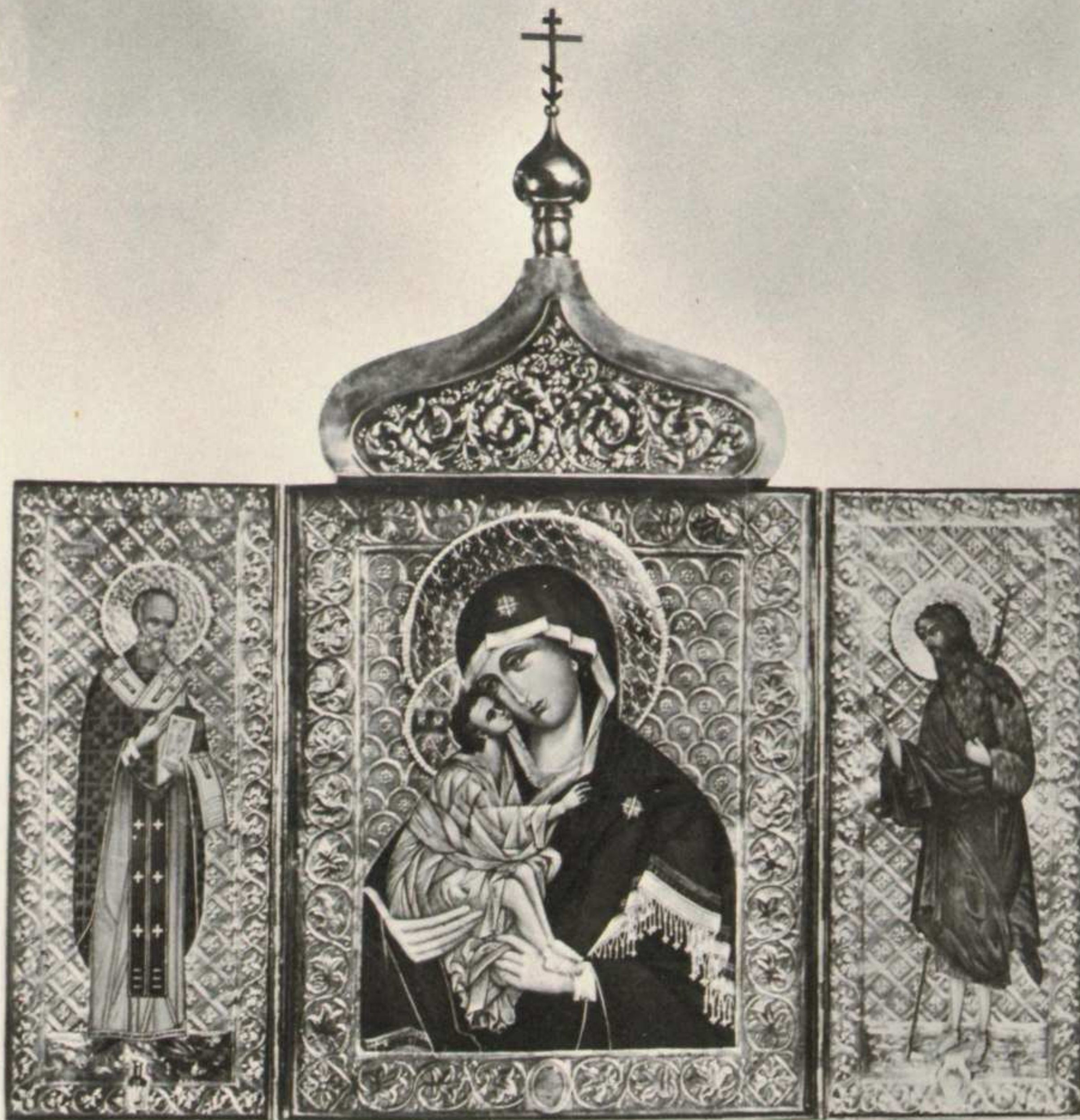
Икона Донской Божіей Матери, Св. Іоанна Предтечи и Святителя Николая Чудотворца Бойковой Сѣбразъ Войска Донского